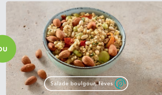
Salade boulgour, fèves