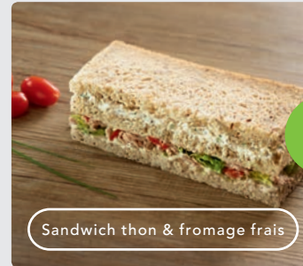
Sandwich thon & fromage frais