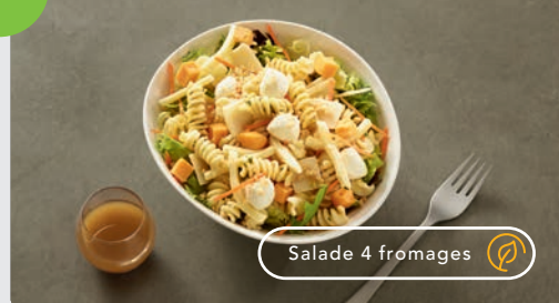
Salade 4 fromages

Le bon plan +1€80 la Soupe froide à la tomate de Marmande ou la Confiserie