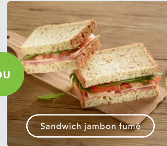
Sandwich jambon fumé

Le bon plan +1€80 la Soupe froide à la tomate de Marmande ou la Confiserie