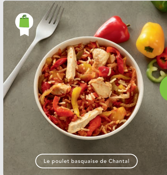
Le poulet basquaise de Chantal