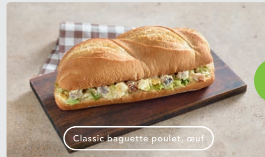
Classic baguette poulet, œuf