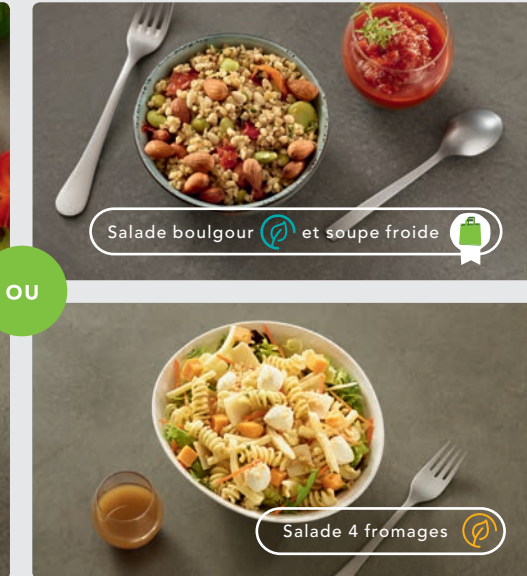
Salade boulgour et soupe froide