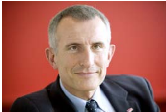
Edito de Guillaume Pépy, Président de la SNCF

« Qui n'a jamais pris le train pour partir en vacances ? Qui n'a pas rêvé de traverser l'Europe à bord de l'Orient Express ? Le train est une formidable invitation à voyager, un voyage en soi. Il y a bien sûr les trains touristiques, aux noms évocateurs : Mont-Blanc Express, Train des Merveilles, Train Jaune... qui sont des destinations en eux-mêmes. Mais le train est aussi un extraordinaire moteur du développement économique et touristique. TGV et TER ont redessiné la France.